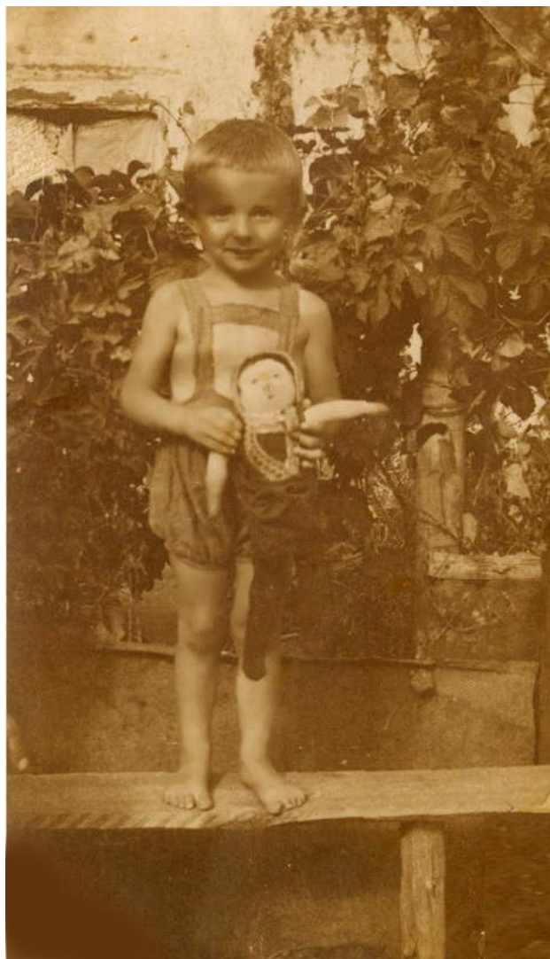
Фото 1. Я с куклой Лёлей

Может, это было не один раз, потому что – запомнилось. И даже не