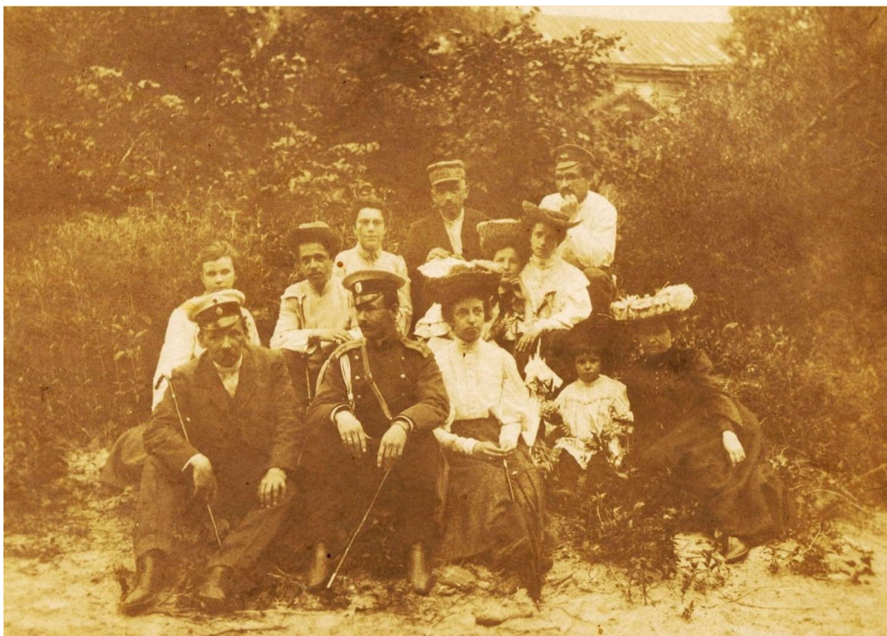
Фото 2. Мама с бабушкой в группе бабушкиных знакомых

Бабушку, с которой я жила, помню и хорошо, и не очень. Помню её лицо, старческую уже походку. Молодой не видела даже на фотографии, их не было. Почему, не знаю. Только одна. Небольшой групповой снимок на лоне природы. На траве сидят шесть женщин и четверо мужчин. Мужчины с тросточками, один сидящий впереди в военной форме, офицер. С правой стороны прилегла бабушка, она в темном платье, у остальных женщин светлые кофточки. На маме светлое платье. Кроме неё детей нет, ей лет 6-8. Лица очень мелкие, едва различимы. На головах почти всех женщин шляпы. Особенно выделяется бабушкина шляпа – целый торт. Наверху шляпы лежат цветы, это был «крик» моды в то время (фото 2).