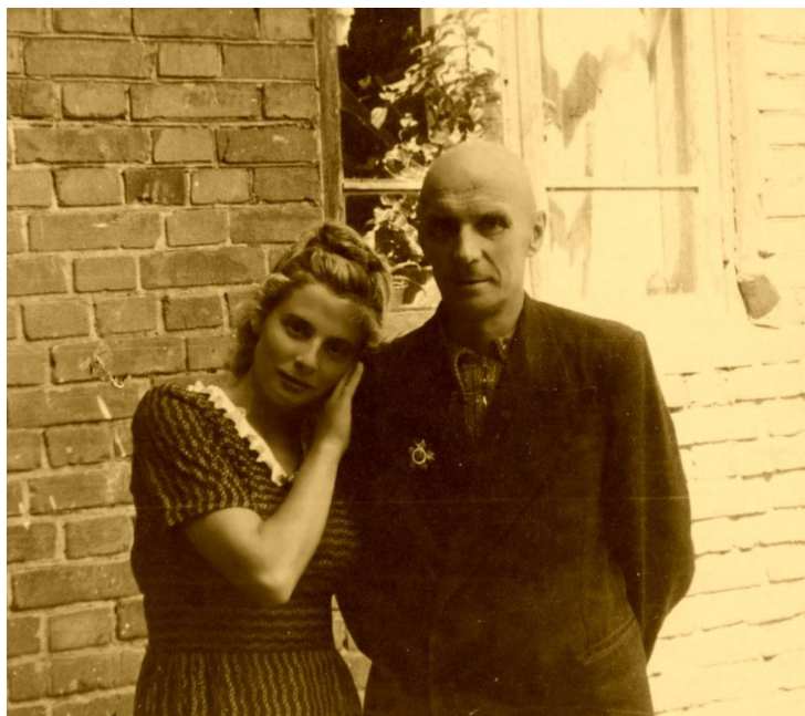
Фото 11. Я с папой, 1950 г.

Добрый и сильный папа был человек. В сорок четвертом году его ранило. Ранение сложное: пуля вошла в ладонь правой руки и вышла, раздробив кость около локтя. Руку тогда не отняли, считали его безнадежным. Но, к счастью, он выжил. Когда приехал из госпиталя, правая рука в локте не сгибалась, вообще не работала, писал левой рукой. И начал разрабатывать руку, несмотря на сильную боль. Сначала заставлял руку подниматься, хотя бы на уровень плеч. Потом заставил её писать, и, в конце концов, даже ел правой рукой (фото 11).