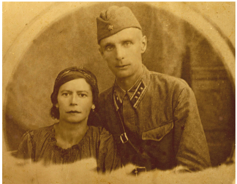
Фото 9. Мама с папой перед отправлением на фронт, 1941 г.

Мама проявила себя ещё во время войны. Передо мною фотография родителей. Июль сорок первого. Папа в гимнастерке с тремя кубиками старшего лейтенанта на петлицах, портупеей через правое плечо, в пилотке. Он слегка наклонился к маме: она, видимо, сидит. На