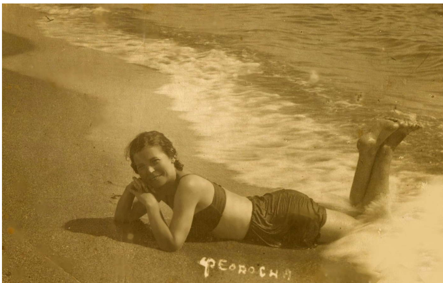
Фото 12. Мама в санатории, Феодосия, 1939 г.

Конечно, поездка была очень интересной, но особенно запомнилась наша прогулка в Ливадию. По дороге туда мы встретили мужчину, видимо, он там работал – рабочий. У него в руках два огромных, величиной с тарелку, белых цветка с сильным, приятным ароматом. Очарованные, мы его остановили и он, рассказав, один цветок подарил нам: «Это вам для нюха». И предупредил, чтобы