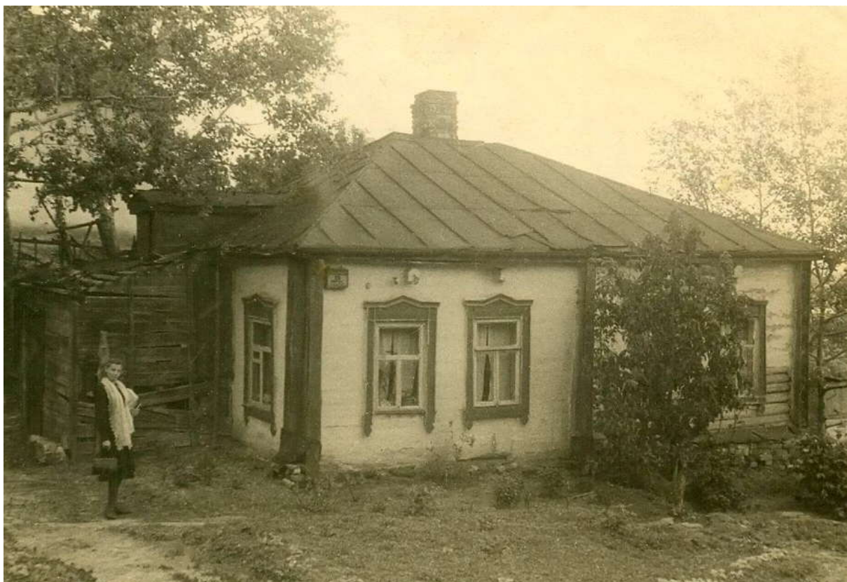
Фото 7. Таким я впервые увидела этот дом

ство. А дом произвел на меня большое впечатление – сплошная романтика! И началась она с улицы (фото 7).