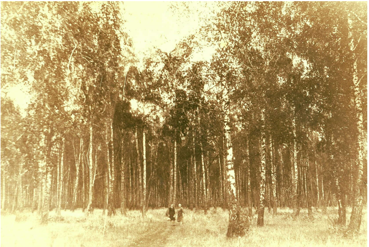
Фото 18. В роще декабристов