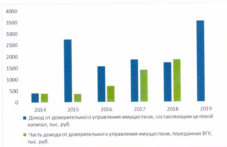
Использование дохода от целевого капитала в 2014-2019 гг.

В 2019 году доход от размещения целевого капитала не расходовался и не перечислялся учредителю. Доход от размещения целевого капитала эндаумент-фонда по итогам 2018 года был капитализирован.