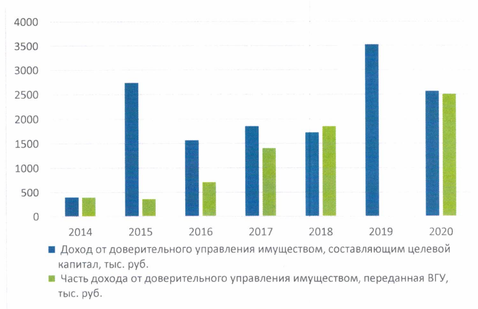
Использование дохода от целевого капитала в 2014-2020 гг.

В 2020 году доход от размещения целевого капитала перечислен учредителю. Доход от размещения целевого капитала эндаумент фонда по итогам 2019 года полностью капитализирован.