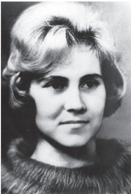
Тамара Люхина. Двукратная олимпийская чемпионка по спортивной гимнастике