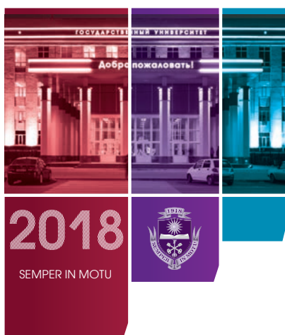
ГODOVЫЙ ОТЧЕТ ФГБОУ ВО «ВОРОНЕЖСКИЙ ГОСУДАРСТВЕННЫЙ УНИВЕРСИТЕТ» ЗА 2018 ГОД

Экстраполировать их на свой коллектив, на свой участок работы, — ответственное и творческое дело каждого из нас.