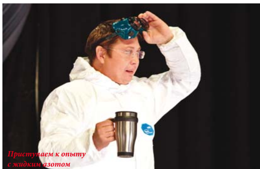
Приступаем к опыту с жидким азотом

— Фестиваль науки — это очень важное событие в жизни Воронежа и области. Мы продвигаем естественнонаучные направления, физику, химию, биологию, именно от них зависит инновационное развитие нашей страны. Это мероприятие очень важно, оно способствует привлечению талантливой молодежи к исследовательскому поиску, формированию устойчивого интереса к знаниям, повышению престижа науки. Мы учим школьников мыслить научными парадигмами, увлекаем прекрасными опытами.