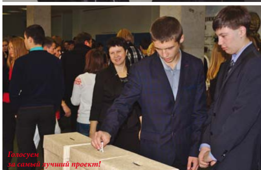
Голосуем за самый лучший проект!

С каждым годом все больше молодых людей принимают участие в Фестивале, это говорит о тяге молодежи к знаниям. Хочу пожелать им сохранять это стремление всю жизнь, — сказал ректор.