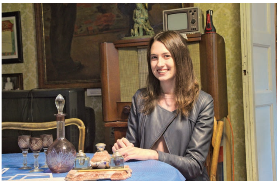
В старинном интерьере можно сфотографироваться!