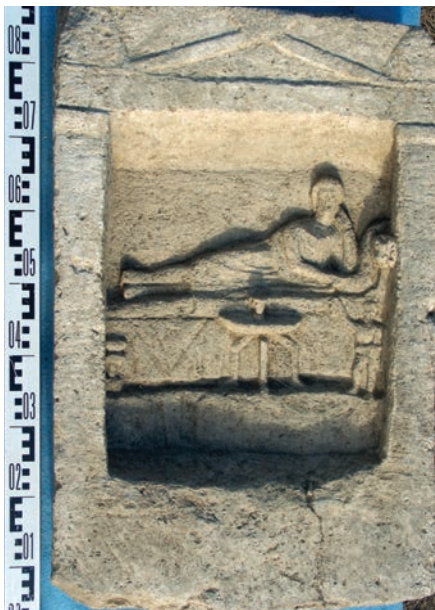
Фанагорийский рельеф I века н.э.