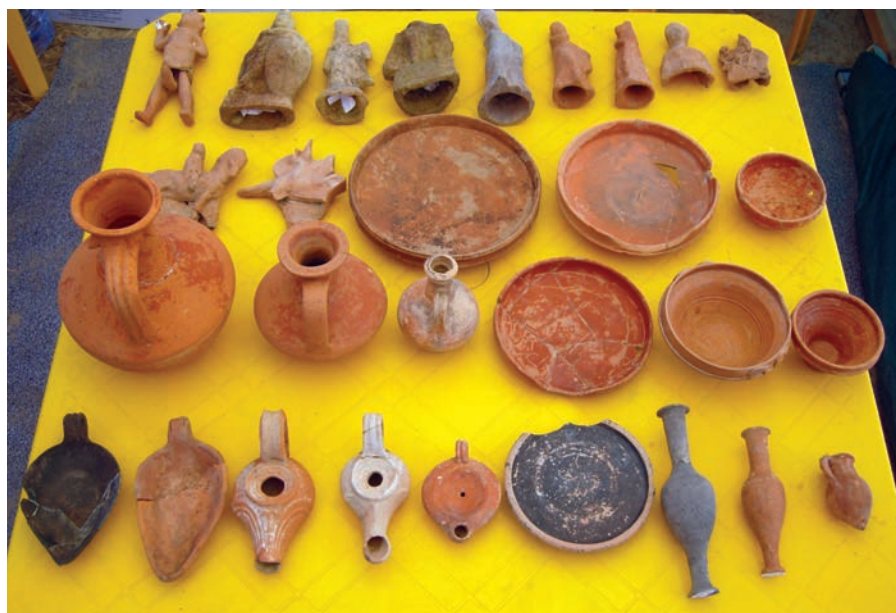
Находки в некрополе в Фанагории

В 2018 году кафедра археологии и истории древнего мира ВГУ отмечает свой полувек юбилей. В отличие от других университетских археологических школ, как правило, нацеленных на изучение какой-то одной проблематики, в нашем университете сложилось сообщество ученых различных археологических направлений: эпохи бронзы, скифологии, сарматологии, антиковедения, славяно-русской и золотоордынской археологии. Кажется, именно наличие двух взаимосвязанных блоков — археологии и антиковедения — позволило нашей кафедре сохраниться в качестве самостоятельной университетской структуры, что вряд ли было бы возможным, если бы она была только «кафедрой археологии» или «кафедрой истории древнего мира».