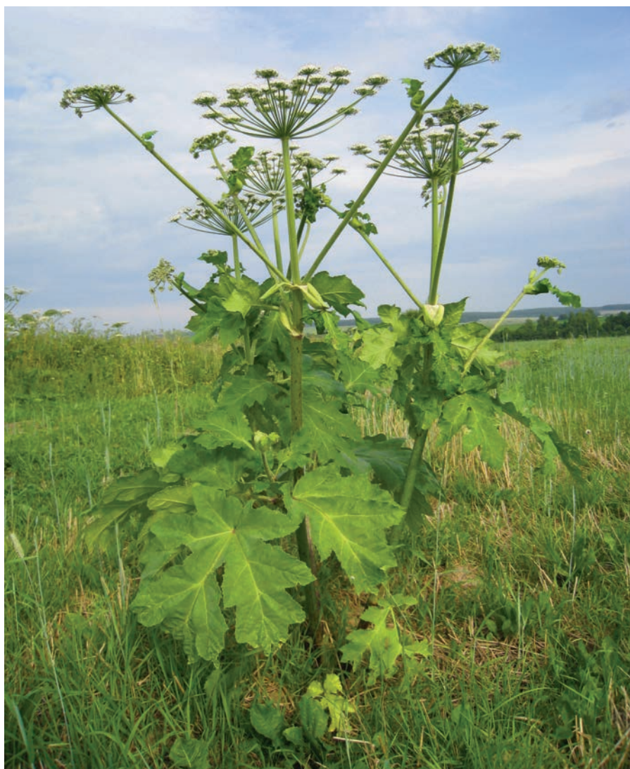
Борщевик Сосновского: общий вид