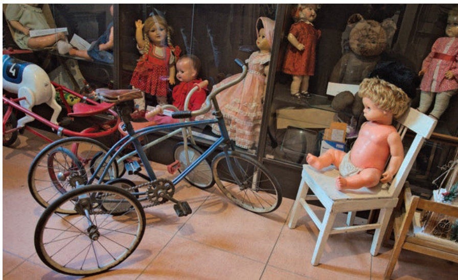
В детской экспозиции