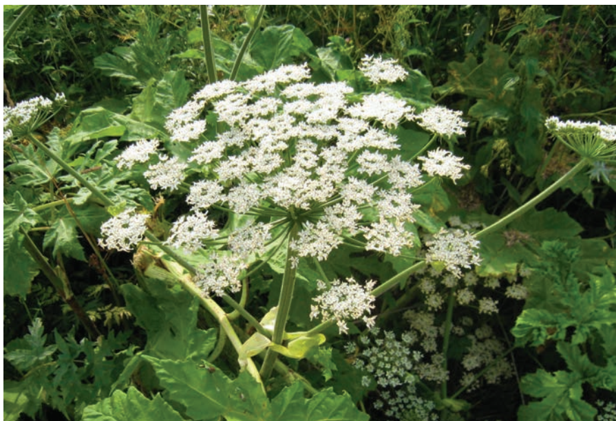
Соцветия Борщевика Сосновского

Один великий учёный сказал: «Хотите угробить хорошее дело, дайте в руки учёным: они теоретически обоснуют, методически разработают, практически подтвердят — и угробят это дело». В своё время непродуманно ввели в культуру борщевик. НО! Может быть, сейчас непродуманно пытаются его уничтожить? Эта проблема требует детального изучения.