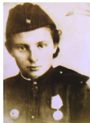
Фото 1. На фронте

Во время войны получила и собственный опыт. Моя армейская жизнь началась в 16 лет. Месяца два в роте дорожников ремонтировала дороги, регулировщицей стала позже. Одна девчонка среди уже не молодых бойцов, бывших колхозников. В те годы ещё не все были грамотными, плохо читали и писали, неправильно говорили. Словом, другой мир... Но уже тогда поняла, что всё это не главное, не имеет значения. Среди бойцов были с ленцой, но большинство умело, добросовестно трудились. Неправильная речь, но правильные, умные мысли, поступки... И все относились ко мне очень по-доброму, заботливо, старались облегчить тяжёлую работу и не обидеть. Человечно.