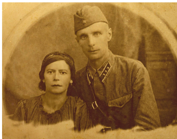
Фото 3. Мои родители – ангелы

Вспоминаю, в эти дни – врач нашей санчасти спросила: «Вас сильно ругали дома?». «Нет, совсем не ругали». «Ангелы! Ваши родители – ангелы!» (фото 3). Да, моим родителям досталась я тяжело. Но доктор была права – они ангелы: с их стороны, и от брата, никогда не слышала ни слова упрёка, хотя за мой долг все расплачивались несколько лет.