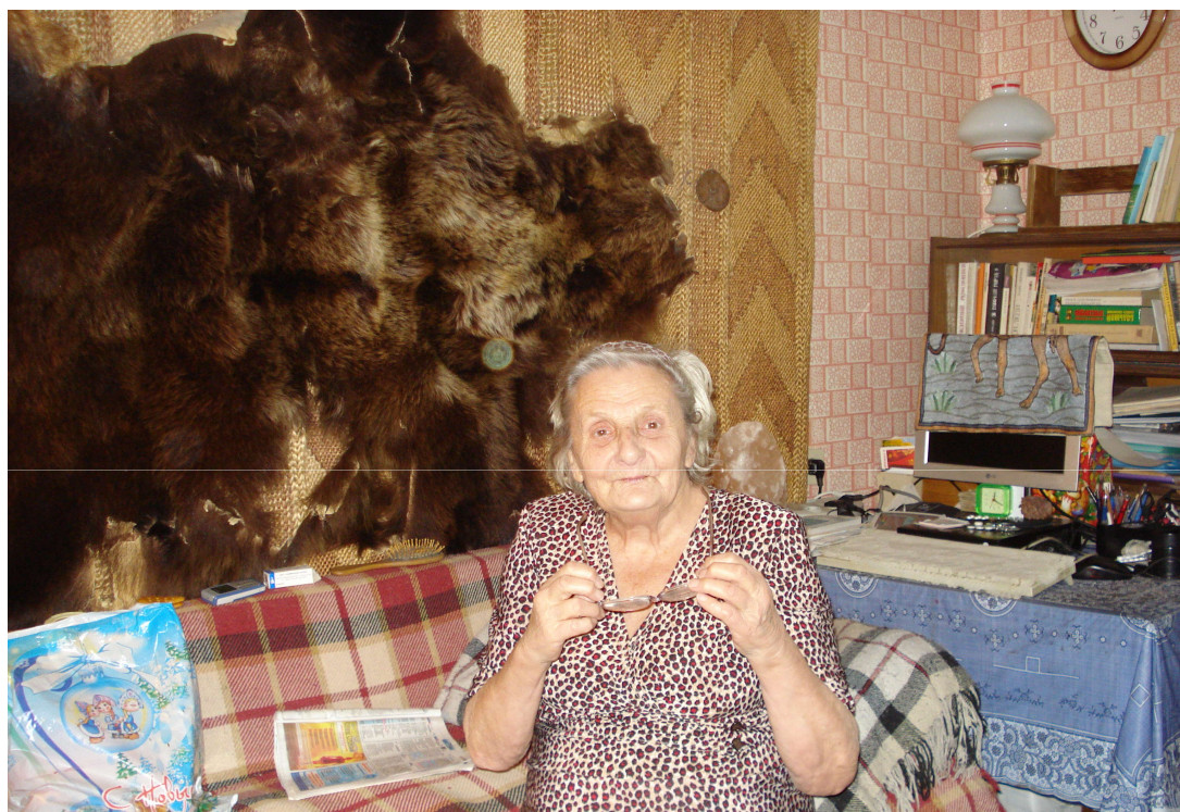
Фото 7. Среди своих родных и любимых вещей...

Теперь на диванчике сплю я (и не хочу менять), а стол стоит в головах, на нём компьютер, лампа, книги... (фото 7). На компьютере умею набирать текст, менять шрифт, остальное делают мои внуки. Они и научили азам пользования.