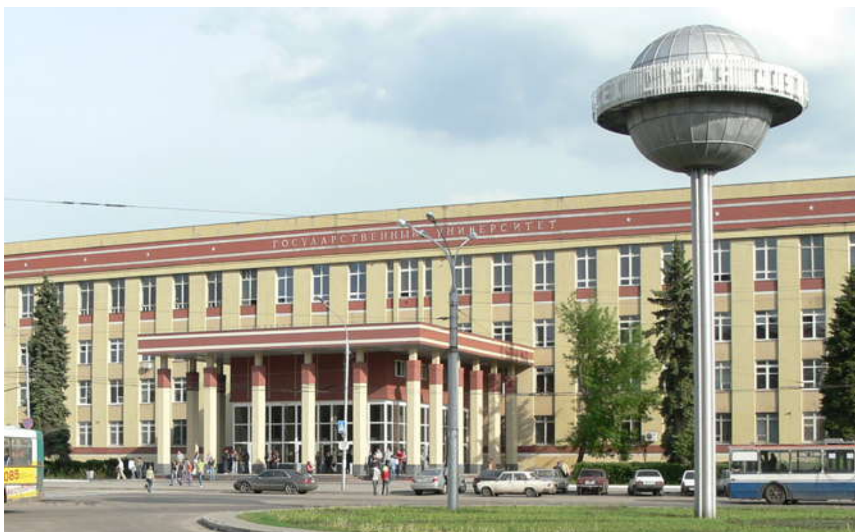
Фото 9. Воронежский государственный университет

Твой орден и твоё имя, как символы единения мудрости и молодости, – самый дорогой сплав. Мы гордимся тобой и верим в твой дальнейший расцвет, наш Воронежский ордена Ленина государственный университет имени Ленинского комсомола.