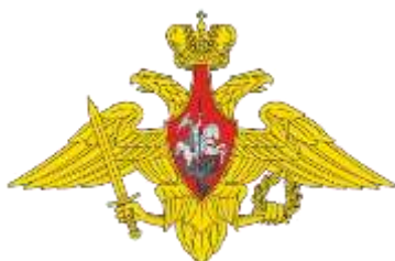
Факультет военного образования