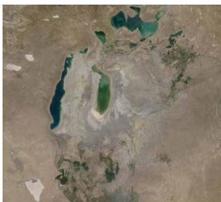
Аральское море в 1964 и 2018 гг.

О положении Балтийского и Карского морей разговор отдельный. Балтика считается одним из морей с особенно плачевным экологическим состоянием. После Второй Мировой войны здесь было захоронено химическое оружие с содержанием четырнадцати ядовитых веществ. По подсчётам специалистов на дне Балтики (средняя глубина — 52 м) покоятся более 50 тыс. т боевых отравляющих веществ, 267 тыс. т бомб, снарядов и мин. К тому же, на дне Балтики лежат несколько затонувших советских подводных лодок, а со сточными водами в море ежегодно попадает 600 тыс. т неф-