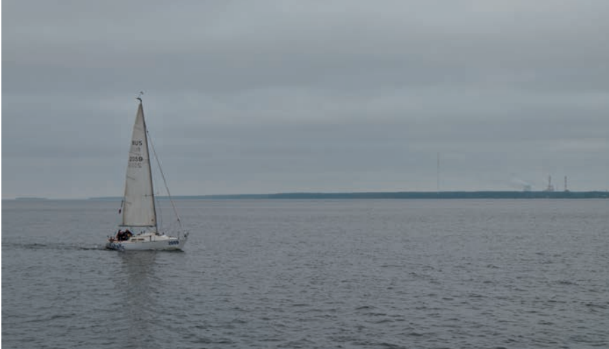
Финский залив Балтийского моря. Самое страшное — под водой!

ти, по 4 тыс. т меди и свинца, 50 т кадмия. Содержание стронция и цезия (вдоль побережья расположены многие АЭС!) в мясе рыбы Балтики превышает ПДК в 5 раз. В 1998 г. в открытых районах моря содержание нефтепродуктов колебалось в пределах от 5 до 112 мкг/л при ПДК = 2,2 мкг/л воды. Не лучше ситуация с Карским морем. В 1960-е гг. на Новой Земле производились многочисленные ядерные испытания, вследствие чего в атмосферу было выброшено 13 млн кюри Cs^{137} . С 1988 по 1998 гг. в море были захоронены (затоплены) 17 реакторов атомного «Ленин» и 11 тысяч контейнеров с опаснейшими отходами. Это море называют «ядерным кладбищем».