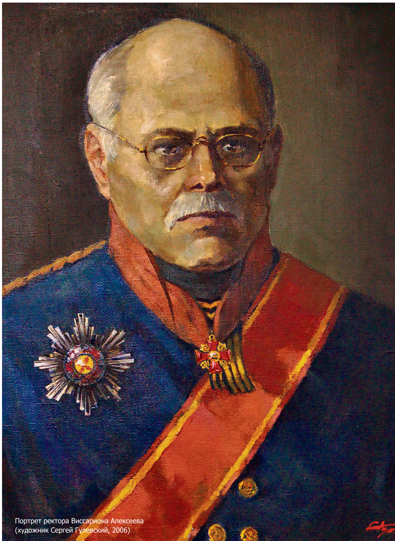
Портрет ректора Виссариона Алексеева (художник Сергей Гулевский, 2006)