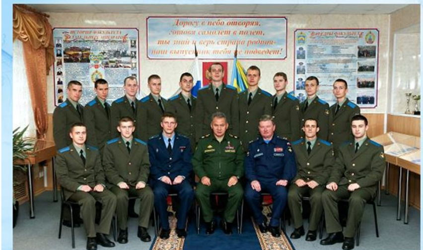
2 научная рота (Военно-воздушных сил)

В 2015 году наш вуз принял участие в брифинге, посвящённом научным ротам, где я выступал с докладом «Векторы развития и направления взаимодействия ВГУ с ВУНЦ ВВС «ВВА» по вопросам комплектования научной роты: опыт и проблемы».